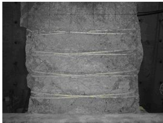
実験終了後の状況（CORDOY は破断しません）