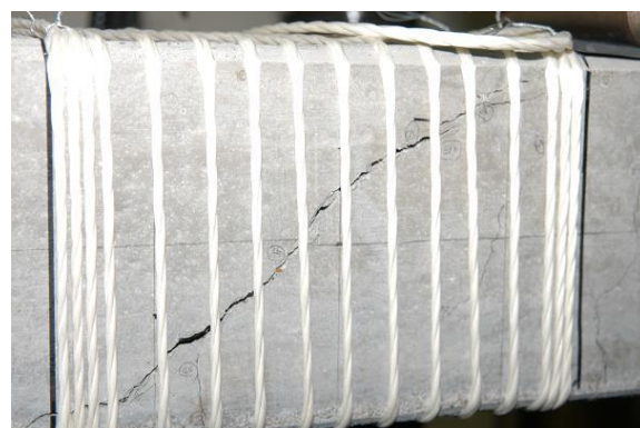
斜めひび割れ状況